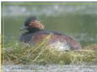
Le Grèbe à cou noir

Podiceps nigricollis Taille : 28 à 34 cm Poids : 250 à 350 gr Envergure : 45 à 55 cm