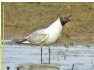
La Mouette rieuse

Larus ridibundus Taille : 35 à 39 cm Poids : 225 à 350 gr Envergure : 86 à 99 cm