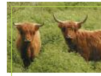
Illustration : Philippe VANARDOIS

De grandes prairies humides ont été recrées pour permettre l'alimentation des foulques et des canards. Leur gestion repose sur la fauche et sur la mise en place d'un pâturage extensif par des animaux rustiques comme la vache Highland Cattle et le cheval Konik Polski. Ces animaux sont sauvages, pour votre sécurité, ne passez pas les clôtures.